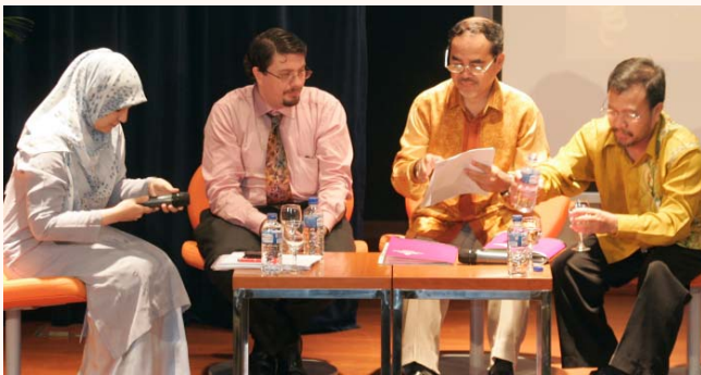
SIES (Singapore Islamic Education System) Seminar 09 at SIH 14 Nov 2009