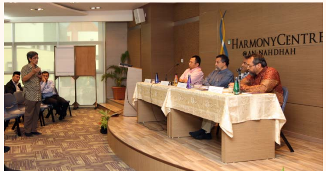
Seminar & Book Launch of Muslim Reform in SEA at Harmony Centre 31 Oct 2009