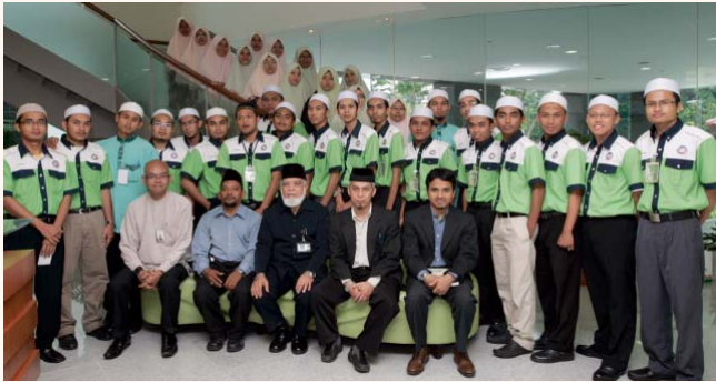
Visitors from the Teaching Institute of Tuanku Bainun, Pulau Pinang at SIH 22 Dec 2009