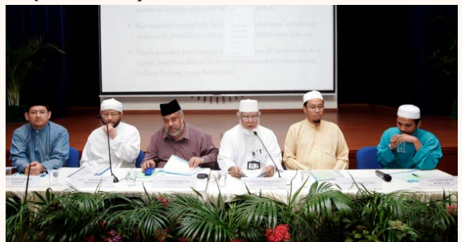
Hari Raya gathering and Fatwa briefing with Asatizah at SIH 10 Oct 2009