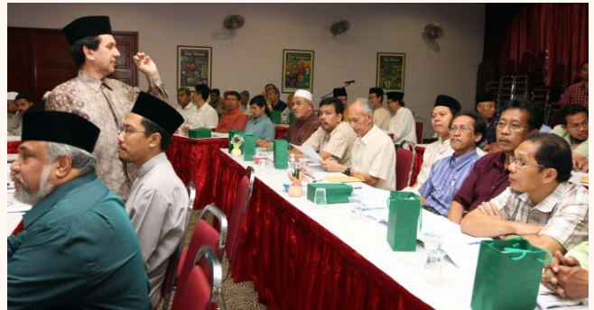
41st Mosque Council Meeting at Assyakirin Mosque 24 Oct 2009