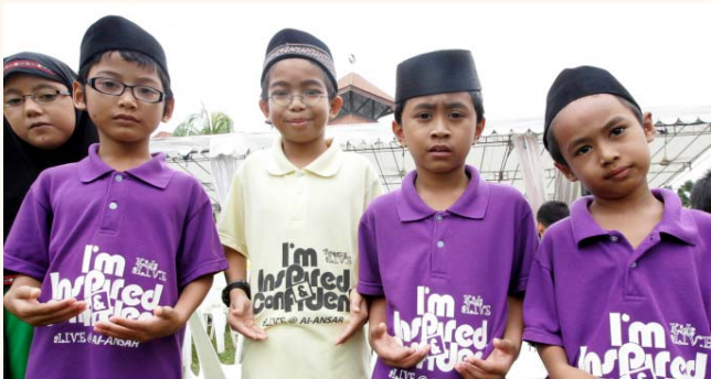
aLIVE Fiesta 09 at Darul Aman 25 Oct 2009