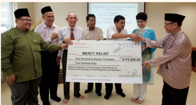
Cheque presentation in support of Mercy Relief's Humanitarian efforts at Muhajirin Mosque 23 Oct 2009