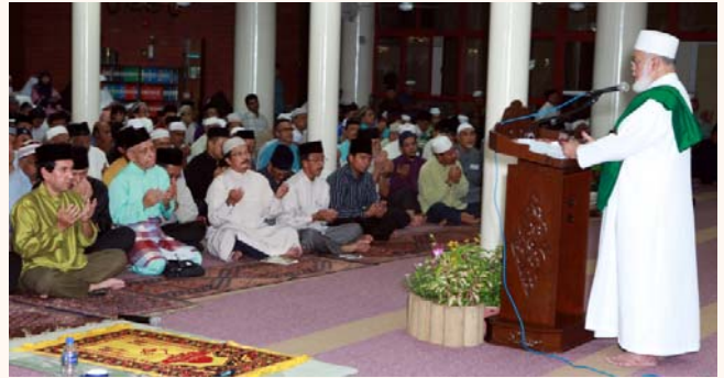
Zikral Hijrah celebrations 1431H at Darussalam Mosque 17 Dec 2009