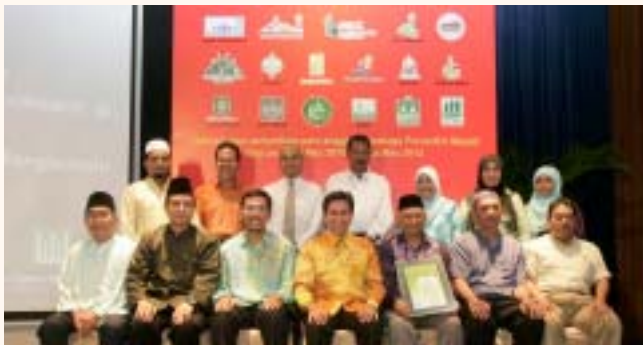
Investiture ceremony for Mosque Mgmt Board at SIH, 10 Mar 2010