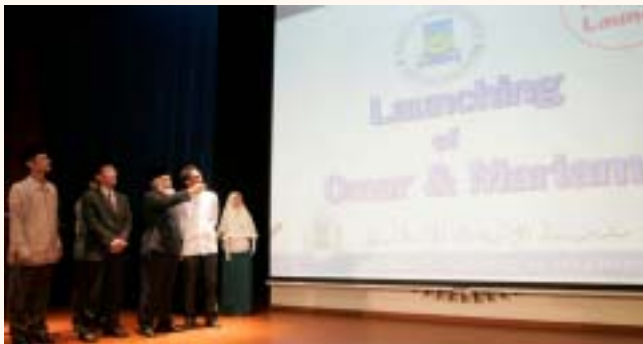
Launch of "Omar & Mariam" eLearning website, 27 Mar 2010 ( http://omarmariam.irsyad.sg )