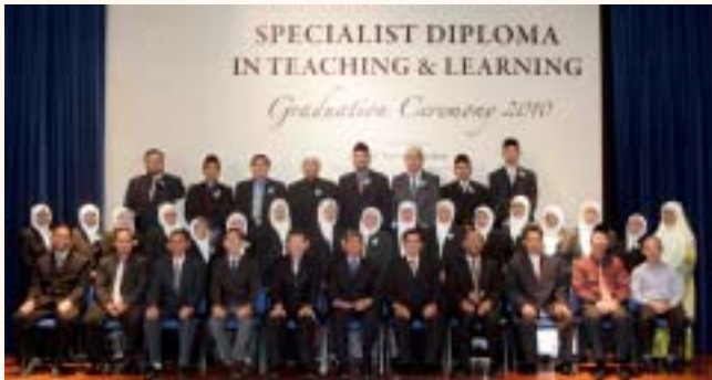
Graduation ceremony for Madrasah Teachers and Asatizah at SIH, 13 Jan 2010