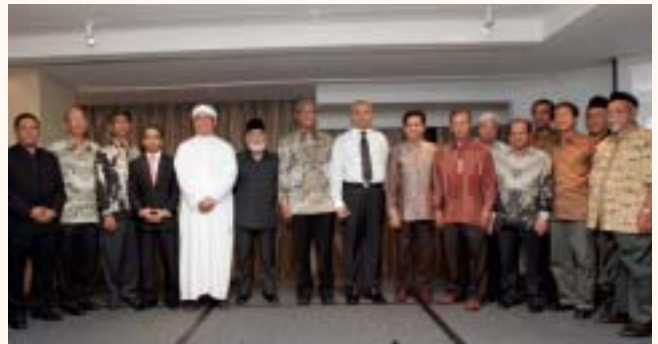
Thanksgiving & appreciation dinner for Haj mission and volunteers at Hilton Hotel, 10 Feb 2010