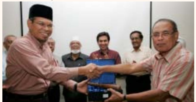
An evening with friends of SIH and announcement of a key appointment changeover, 8 Feb 2010