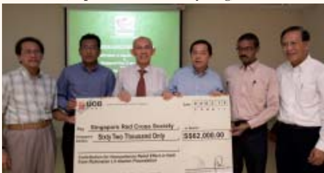
Rahmatan Lil Alamin handover of fund collected in aid of victims of Haiti earthquake, 4 Feb 2010