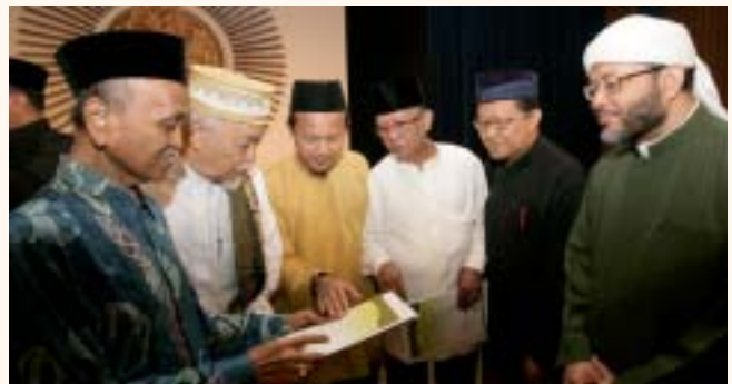
Certificate presentation for Quran teachers' recognition scheme at SIH, 28 Feb 2010