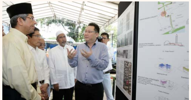
Al Ansar Mosque upgrading project, 14 Oct 2011