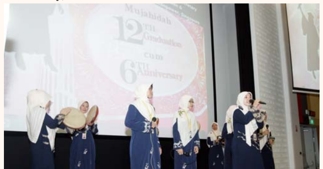
Mujahidah 12th Graduation Ceremony cum 6th Anniversary, 30 Oct 2011