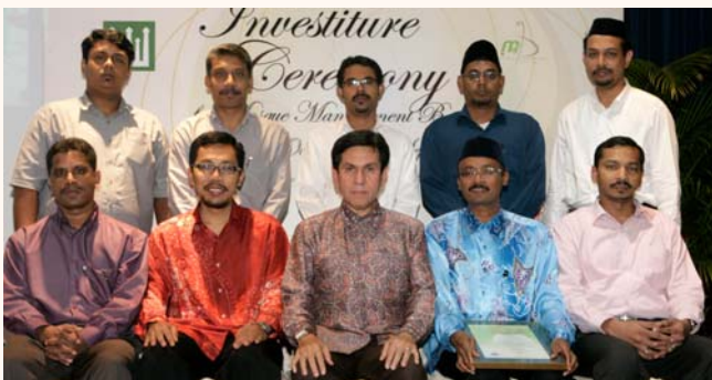
Masjid Jamee Chulia Management Board Investiture Ceremony, 12 Oct 2011