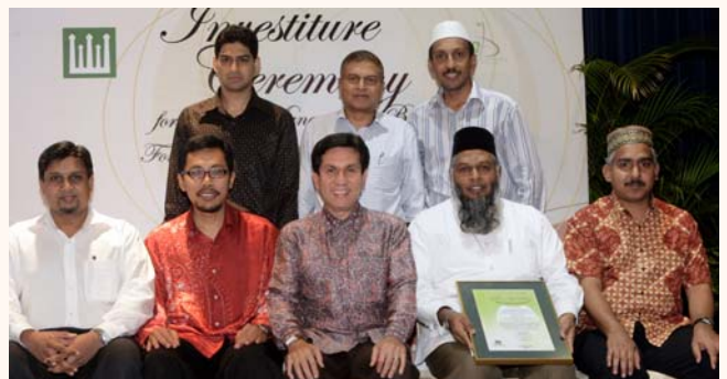
Masjid Bencoolen Management Board Investiture Ceremony, 12 Oct 2011