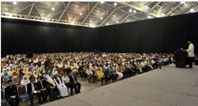
Pre-Haj departure briefing, 1 Oct 2011