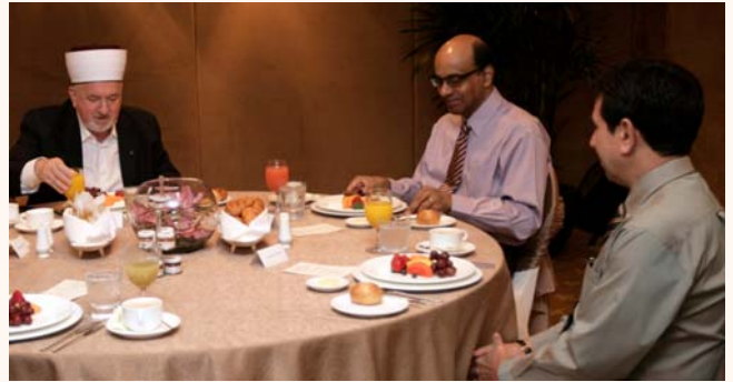
3rd Distinguished Visitors' Prog - breakfast hosted by DPM Tharman Shanmugaratnam, 30 Sep 2011