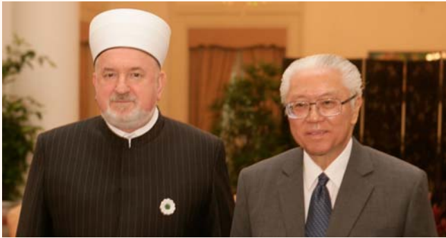
3rd Distinguished Visitors' Programme - courtesy call at Istana, 29 Sep 2011