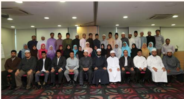
Methodologies in Fatwa (The Darul Ifta Experience) at MUIS Academy, 22 Jan 2014