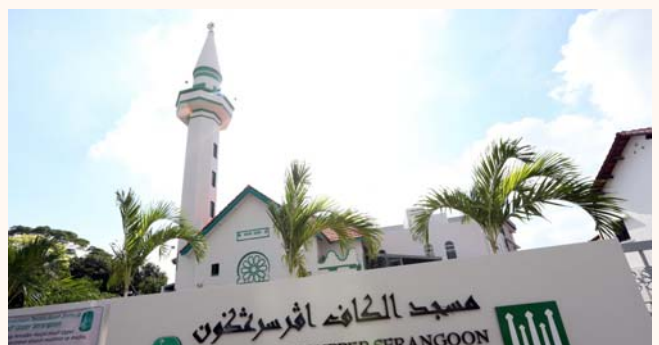
Re-opening of Alkaff Upper Serangoon Mosque, 28 Mar 2014