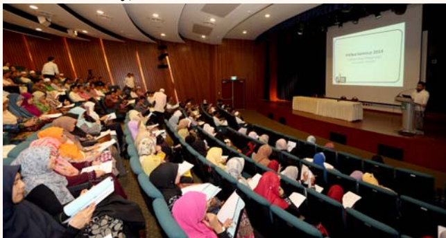
Private Islamic Education Providers (PIENet) Seminar 2014, 22 Feb 2014