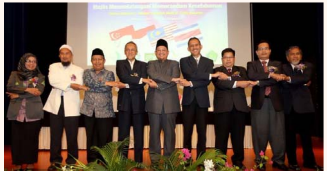
MOU Signing Ceremony - Al-Irsyad & Fitrah Network that spans Indonesia, Malaysia, Singapore & Thailand