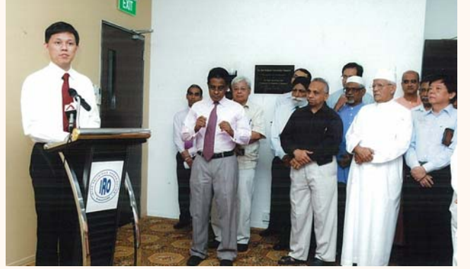
பதிப்பை, குழுத்தலைவர்கள், தூதரகத்தினர் முன்னிலையில் வெளியிட்டார்.

சமூக வளர்ச்சி-குடும்ப மேம்பாட்டு அமைச்சர், திரு. சான் சுன் சிங், சர்வ சமய நிறுவனத்தின் மார்ச் 2014 அதிகாரபூர்வ