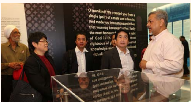
Prime Minister Department Planning Minister YB Minister Tan Sri Joseph Kurup visits SIH, 4 Mar 2014