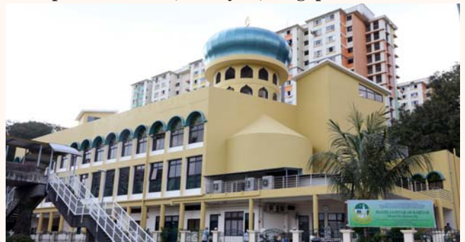
Completion of upgrading work at Jamiyah Ar-Rabitah, 28 Feb 2014