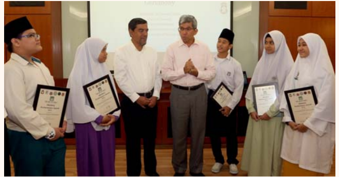
Progress Fund Madrasah Assistance Scheme (PROMAS) disbursement, 30 Jan 2014