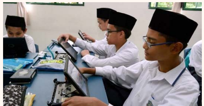
ICT (Information and Communications Technology) education in our Madrasah