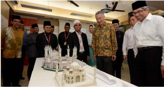
PM Lee Hsien Loong's inaugural visit to Al-Islah Mosque and Iftar, 27 June 2016