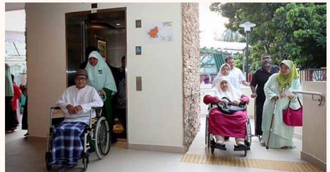
Completion of renovation works (lift added), at Sallim Mattar Mosque, 11 June 2016