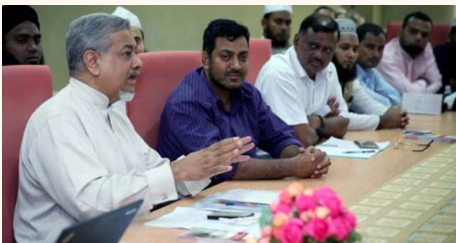
Meeting between MUIS, Spore Bangladeshi Society and Dormitory religious leaders, Assyakirin Mosque