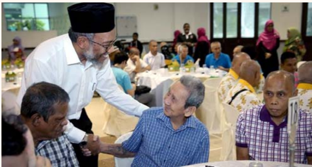
Ramadhan Disbursement Ceremony 2016 (Rahmah Ramadhan 2016), 24 June 2016