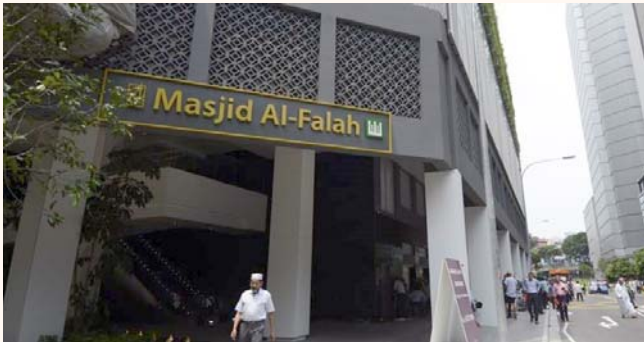
Al Falah Mosque reopens after upgrading works, 22 April 2016