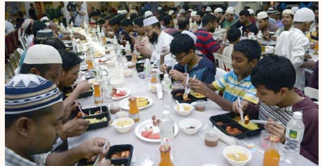
Iftar at Al-Ansar Mosque, "Eat Well, Waste Less", in line with this year's Touch of Ramadhan