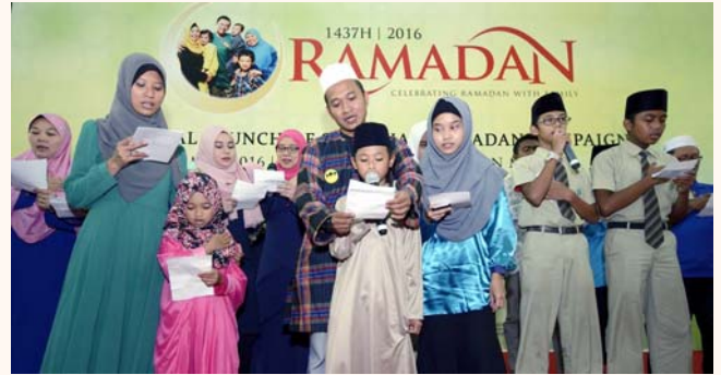
Official launch of the Touch of Ramadhan (Sentuhan Ramadhan), 29 May 2016