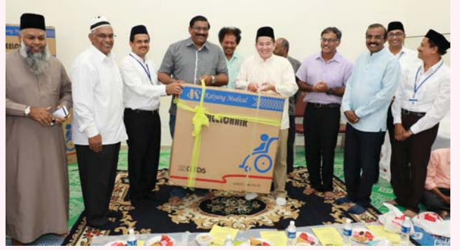
இஃப்தாரில் கலந்து கொண்டனர்.

அல் முத்தக்கீன் பள்ளிவாசல் மூன்றரை மில்லியன் வெள்ளி செலவில் புதுப்பிக்கப்பட்டுள்ளது. அங் மோ கியோ குழுத் தொகுதி நாடாளுமன்ற உறுப்பினர்கள், முயிஸ் பிரதிநிகள் உள்ளிட்ட 400 பேர் இந்த