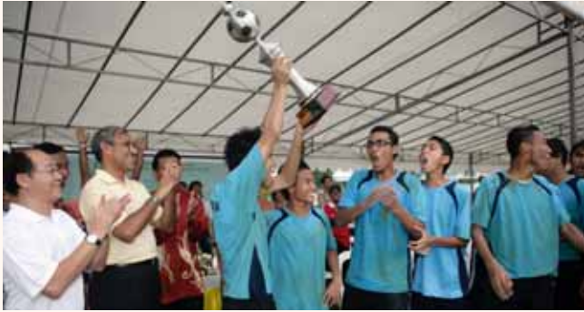
“Singapore Mosques Challenge Trophy 2007” soccer competition at Jalan Damai on 31 Dec 2007