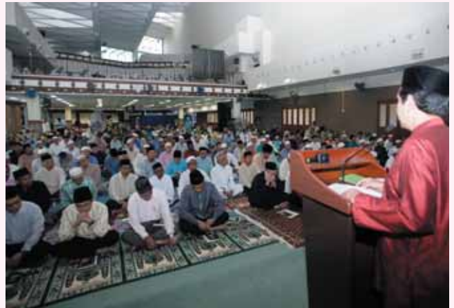
தாருல் குஃப்ரான் பள்ளிவாசலில் நடைபெற்ற முஹர்ரம் சிறப்பு நிகழ்ச்சி