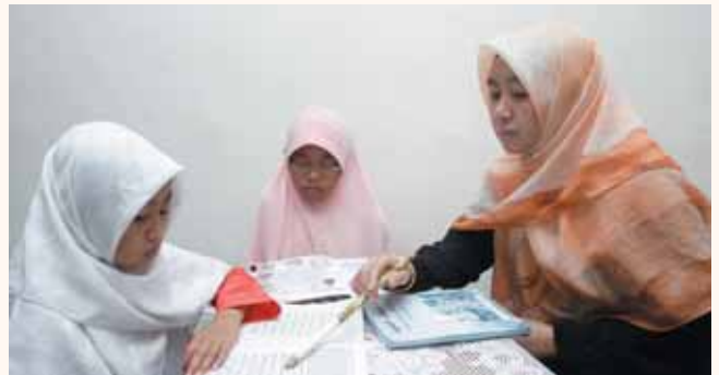
Religious home tuition at Blk 832, Woodland Street 32 on 17 Feb 2008