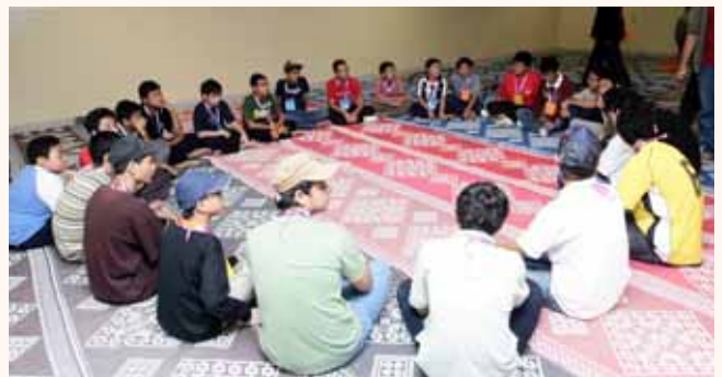
aL.I.V.E. adventure camp at Al-Iman mosque on 22 Dec 2007