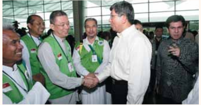
Minister sending off pilgrims at Changi Airport on 9 Dec 2007