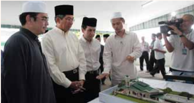
Commencement of Abdul Razak Mosque project on 15 Feb 2008