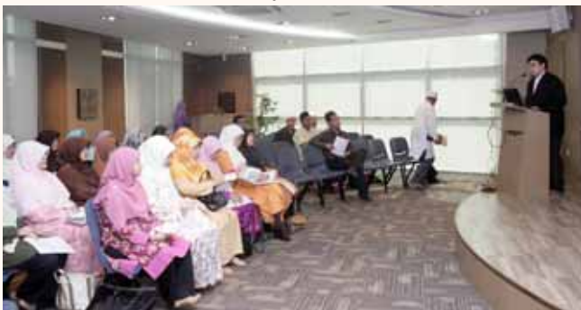
aL.I.V.E. administrators meeting at An-Nahdhah Mosque on 1 Feb 2008