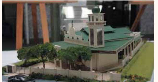
Model of Abdul Razak Mosque