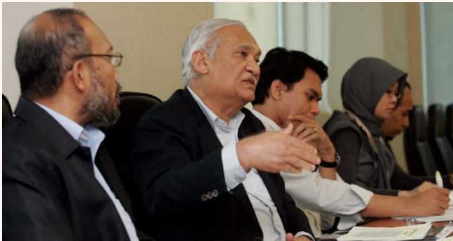
Round table discussion with Prof Riaz Hassan at SIH, 1 Oct 2010