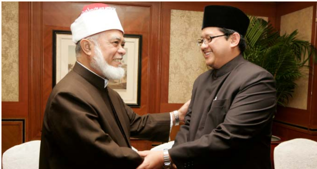
Announcement of new Mufti - Sohibus Samahah Mohamed Fatris Bakaram of Singapore, 11 Nov 2010