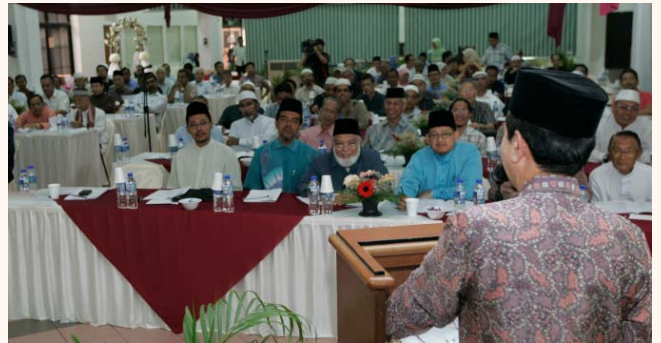
43rd Mosque Council meeting at Al-Amin Mosque, 27 Nov 2010