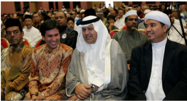
Pre-Haj departure briefing at Singapore Expo, 2 Oct 2010