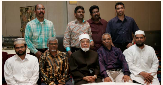
Appreciation dinner in honour of Mufti Syed Isa Semait at Furama City Centre Hotel, 31 Dec 2010