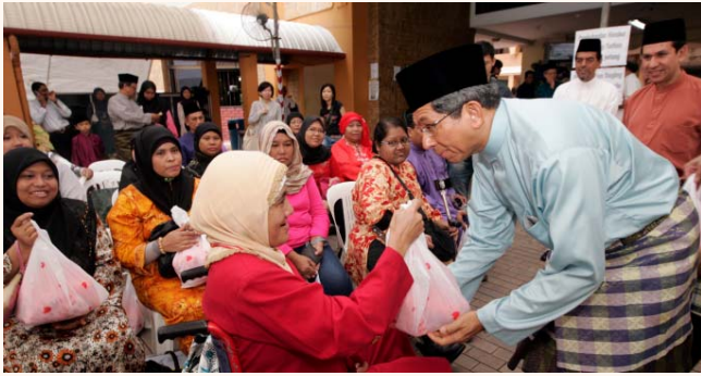
Eidul Aldha prayer and distribution of meat at Al-Muttaqqin Mosque, 17 Nov 2010