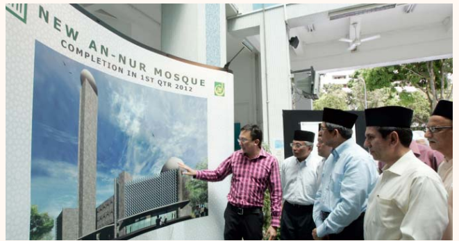
Launch of An-Nur Mosque's main upgrading project, 26 Nov 2010