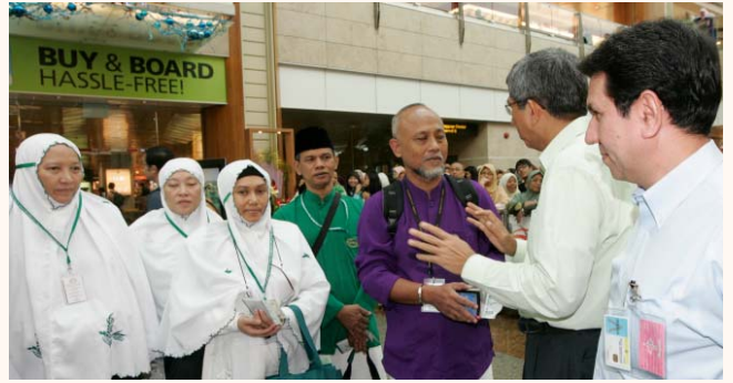
Haj pilgrims send off at Changi Airport Terminal 2, 10 Nov 2010