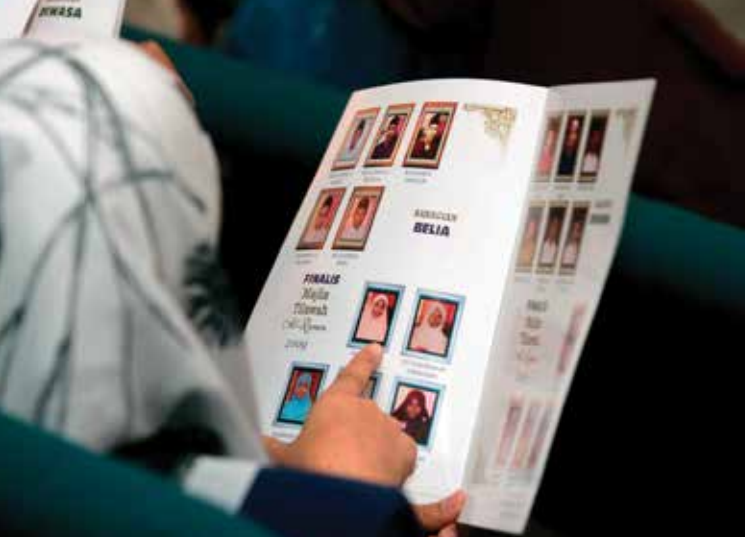
Buku yang diterbitkan sewaktu majlis Musabaqah juga menyenaraikan para finalis qari, qariah dan belia untuk tahun itu