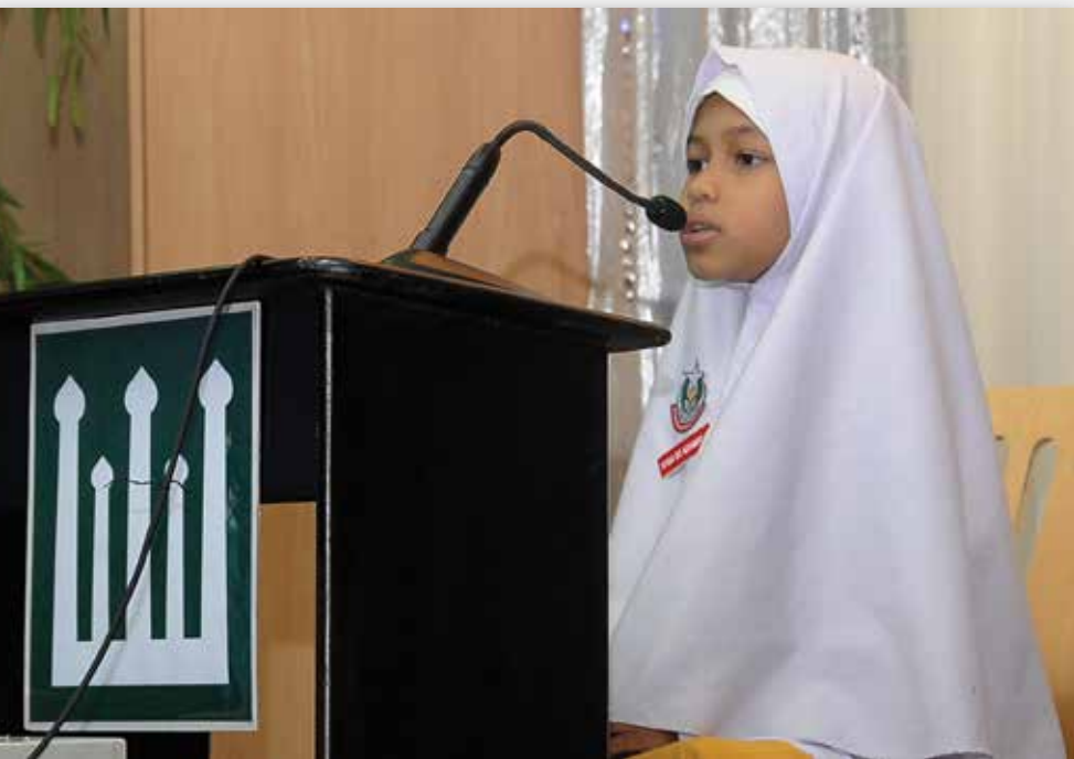
| Seorang peserta cilik kategori Tahfiz sedang menjawab soalan

Atas dasar itu, penganjur bagi acara MTQ telah diamanahkan untuk mengendalikan juga peraduan Tahfiz Al-Quran pada peringkat nasional.