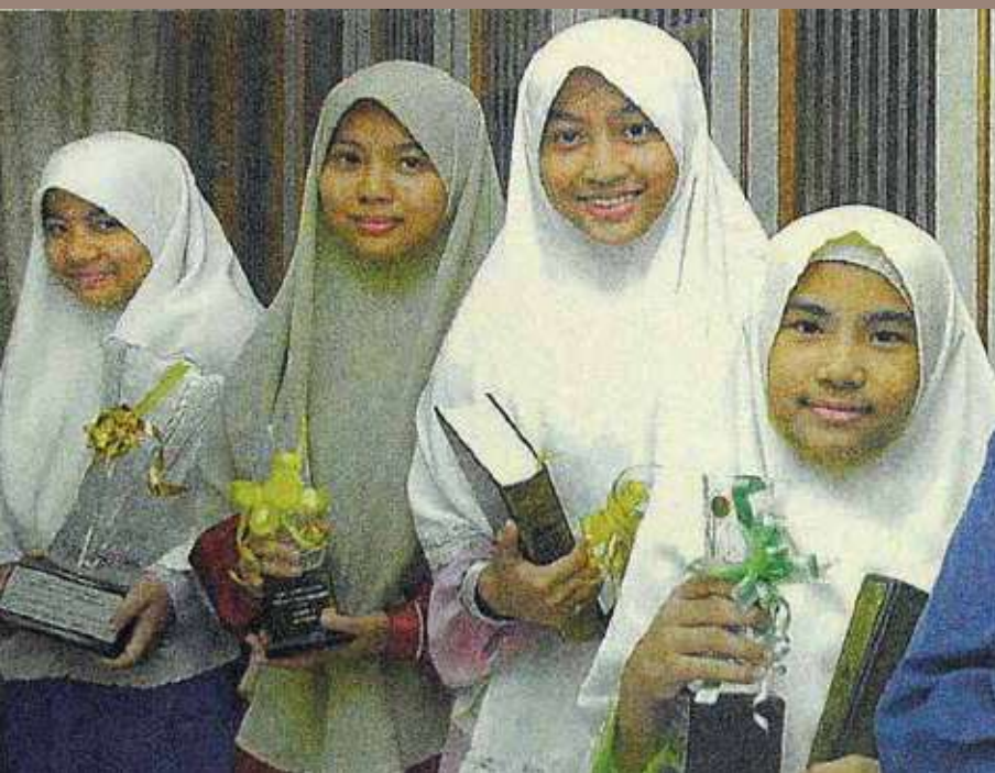
Adik-beradik keluarga Khamsani dengan hadiah trofi yang dimenangi semasa tahun 2002