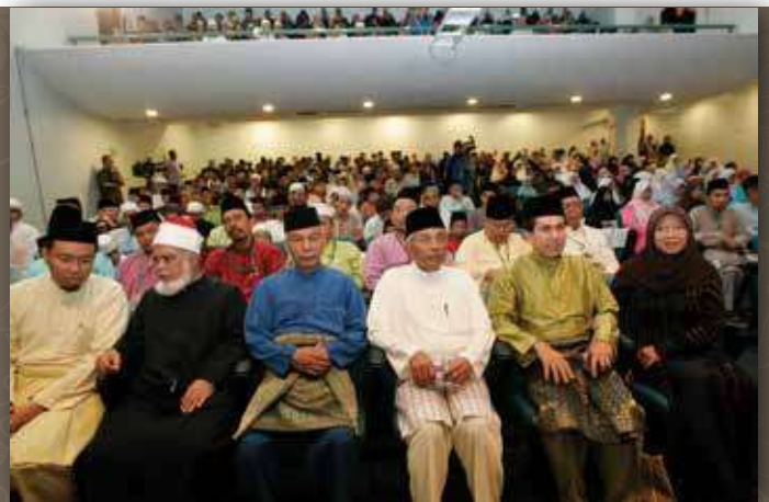
Kemeriahan acara Musabaqah Tilawatil dan Tahfiz Al-Quran dapat dilihat dengan betapa ramainya kehadiran pencinta Al-Quran