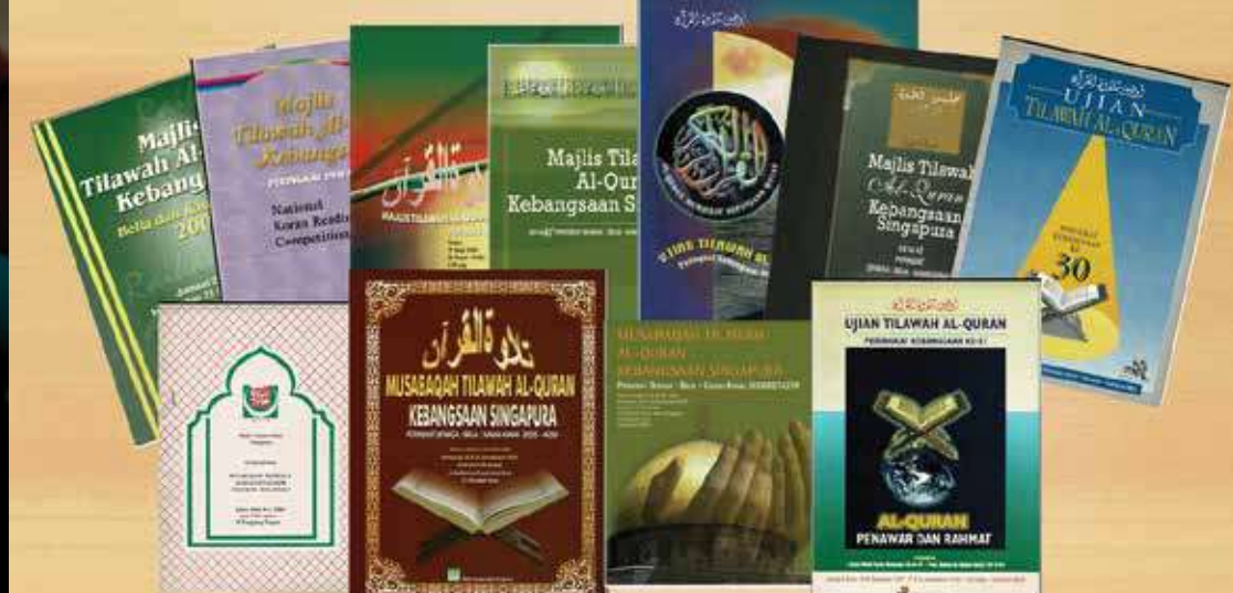
Antara buku-buku Musabaqah Tilawatil dan Tahfiz Al-Quran yang diedarkan sewaktu majlis musabaqah