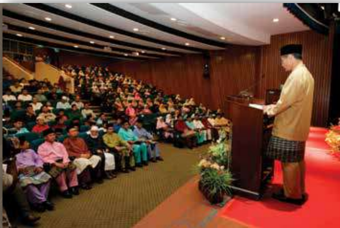
Majlis Tilawah dan Tahfiz Al-Quran pertama kali diadakan di auditorium Hab Islam Singapura pada tahun 2009