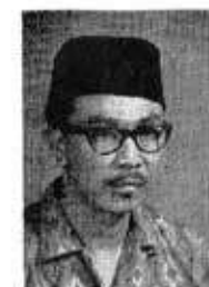
فراوتوسن فروسي جوانكواس اوجين القرآن تكارا ويليك سيغافورا

دغن نام الله نبع منها تفاسنه لآكي مها فيابغ. ساي سديكن فراوتوسن ريفكس اين دغن مفوضك كسكوران كحضرة اوهم اعتله مديفك رسة دان كويسان دافة كيت برسام ٢ ددالم مجلس بجان القران بع مليا اين.