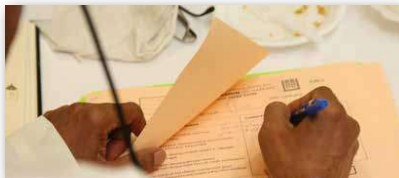
Pembahagian markah dijaga rapi supaya tiada kebocoran maklumat

Antara latihan peribadi Ustaz Afandi adalah membuang lendir dari tekak agar membolehkan seseorang qari mencapai lagu dan taranum yang dihajati.