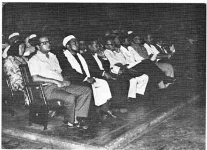
Gambar menunjukkan sebahagian kaum bapa yang menghadiri Musabaqah Al-Quran tahun 1979