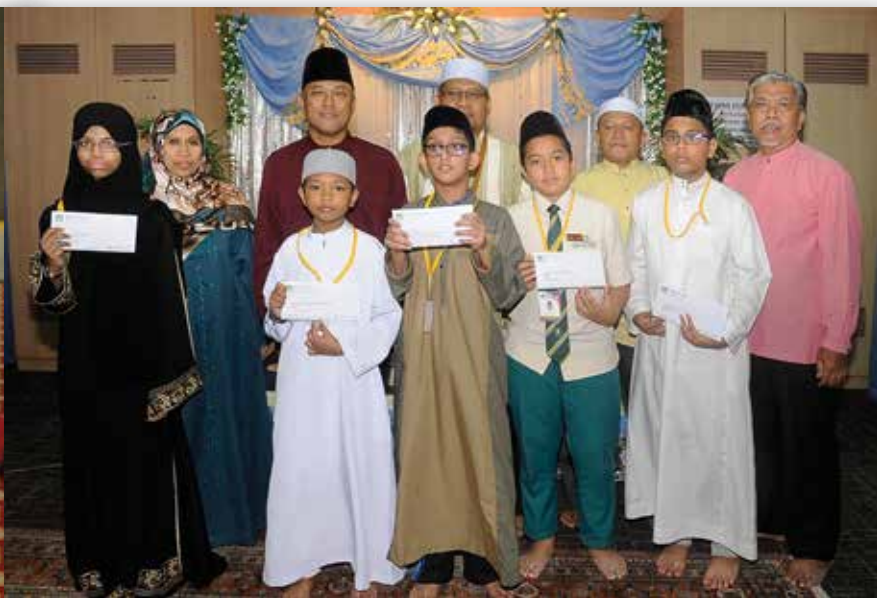
| Para pemenang musabaqah tahfiz 2017