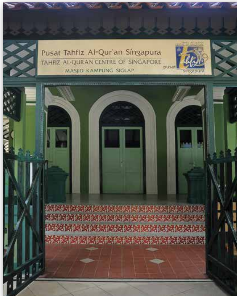
Pusat Tahfiz Al-Quran Singapura dibuka pada tahun 1999 di bangunan masjid lama Kampung Siglap

Selepas penubuhan Pusat Tahfiz yang telah diumumkan dalam Majlis Zikral Hijrah pada 16 April 1999, sebanyak 250 permohonan untuk kemasukan pelajar telah diterima. Bagaimanapun, disebabkan keterbatasan ruang, hanya 85 pelajar terbaik yang dipilih untuk menyertai program tersebut. Itu pun selepas mereka menjalani ujian kemasukan.