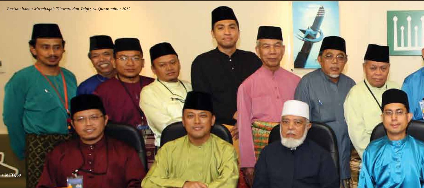
Barisan hakim Musabaqah Tilawatil dan Tahfiz Al-Quran tahun 2012

Bacaan Al-Quran yang diamalkan oleh kebanyakan umat Islam di daerah Asia Tenggara seperti Singapura, Malaysia, Indonesia, Thailand dan lain-lain, ialah dengan menurut bacaan Imam Hafs daripada Imam 'Aasyim Bin Bahdalah Abi Al-Najud ra, iaitu jalan bacaan yang diterima dan dibawa oleh Imam As-Syatibi ra. Dengan pembacaan Al-Quran yang betul, sebagaimana disampaikan kepada Nabi Muhammad saw, panduan daripada Al-Quran menjadi semakin lengkap dan unggul.