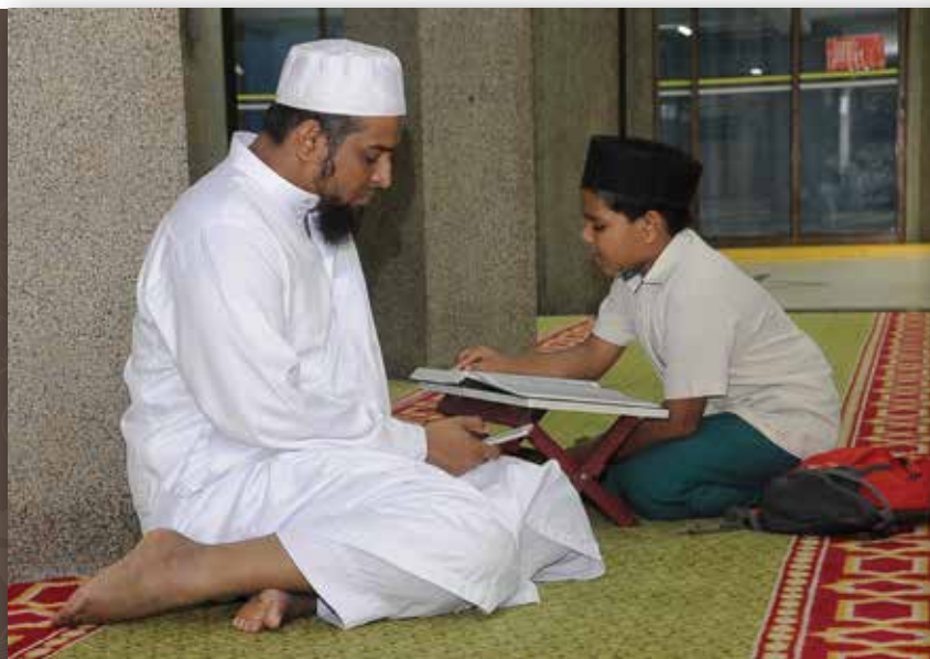
| Program tahfiz disertai pelbagai kaum dan bangsa di Singapura

Sungguhpun usianya masih muda, ia tampak semakin mantap dengan pendaftaran lebih ramai peserta setiap tahun. Besar harapan penganjur, besar lagi harapan masyarakat agar peraduan ini dapat membantu melahirkan lebih ramai hafiz yang akan memakmurkan kitab suci Al-Quran.